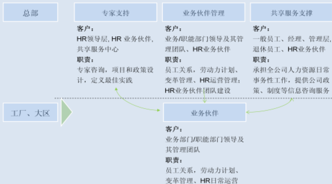
图 3 新职能定位

基于新职能定位，和致建议客户公司按照一收、二放、三培养的实施思路开展新服务模式的转换工作